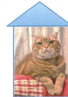
“クッキー” 男の子です。