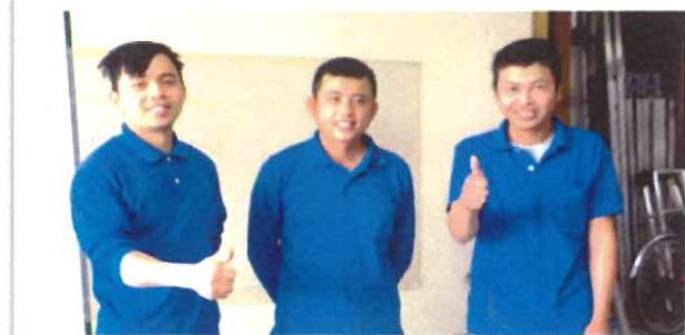
★タインさん ★ティンさん ★トゥエットさん

作業の手順をしっかりと頭に叩き込んで、流れるような動作になっています。日頃、使用する道具たちは言わば戦友！愛情込めて扱っている姿が印象的です。